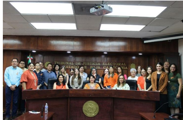
Sesión Informativa "Ley Daryela".