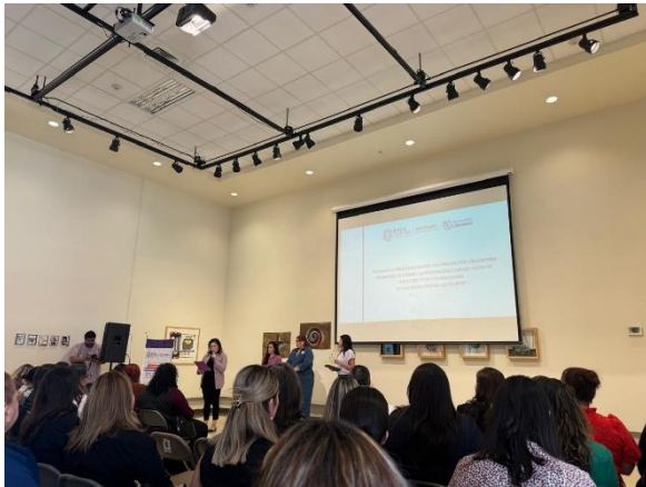
Capacitación Estrategia Género