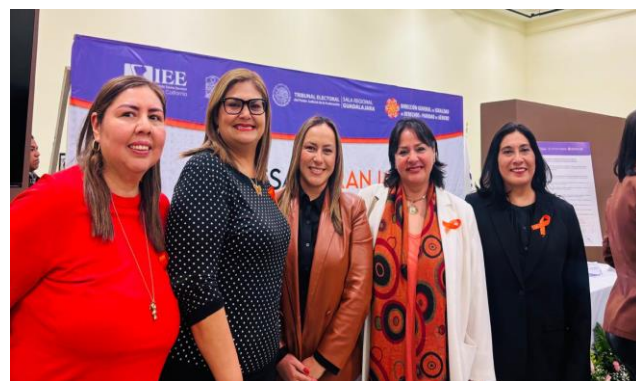
Instalación Cuarta Mesa Naranja.