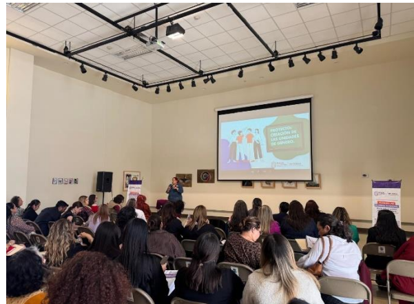
Capacitación Estrategia Género