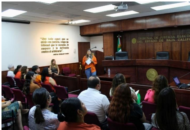
Sesión Informativa "Ley Daryela".