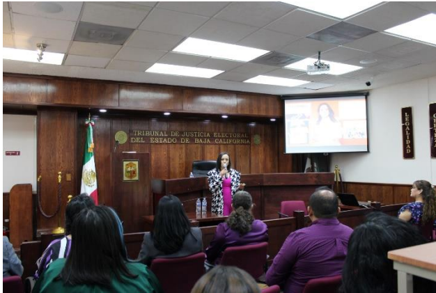
Conferencia Violencia Digital: Los Nuevos Retos de la Justicia Electoral.