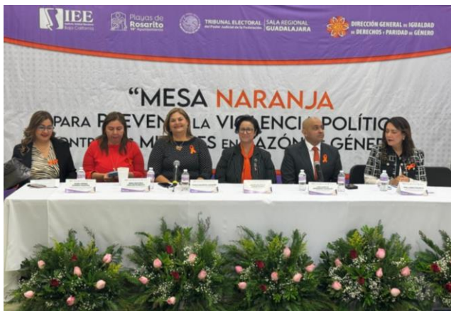
Instalación Cuarta Mesa Naranja.