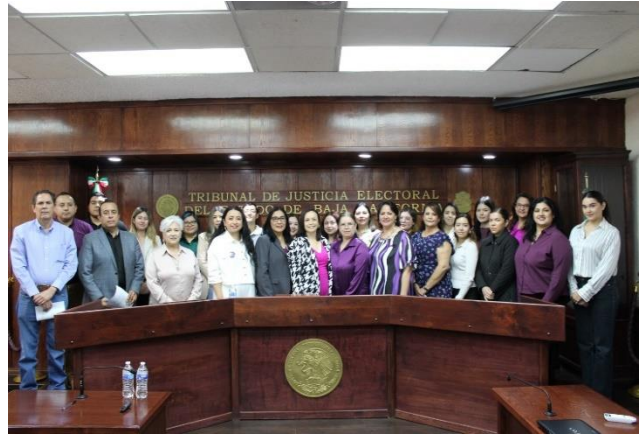
Conferencia Violencia Digital: Los Nuevos Retos de la Justicia Electoral.